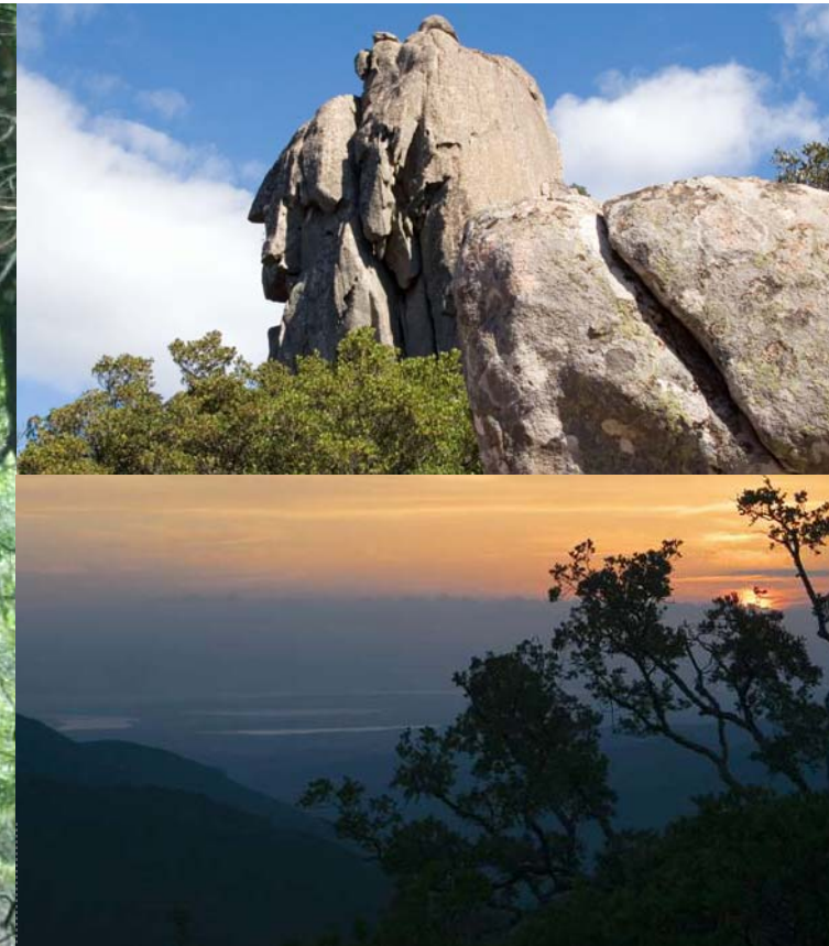
Grafici: Mara Toso